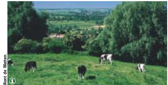
Mont de Watten.

Bocage Flamand et marais Audomarois, au fil de l'Yser