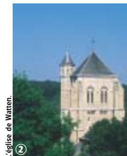
L'église de Watten.

Circuit à découvrir toute l'année ; par sa longueur, cet itinéraire s'adresse à des randonneurs avertis. Il emprunte des chemins divers – voies de balage, sentiers forestiers, rues de village et chemins agricoles – embrasse un large patrimoine naturel et architectural. En période de pluie, porter des chaussures étanches.