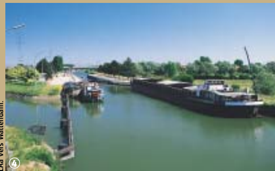
L'Aa vers Wattendam.

s'étend sur 80 km. Il prend sa source à Bourthes, au sud de Licques à 162 m au-dessus du niveau de la mer. Ce haut débit vit l'installation de nombreux moulins, fournisseurs d'énergie, sur ses rives. A Arques, le niveau du fleuve est à peu près celui de la mer ; les eaux se perdent alors dans le marais audomarois, puis dans l'immense delta. Là commence le combat de l'Homme contre l'eau : la mise en place de wateringues, l'installation de vannes et de pompes, évitent au triangle Calais-Saint-Omer-Dunkerque d'être sous l'eau ; alors que la canalisation de la rivière permit la navigation des péniches. Ce petit fleuve côtier, qui voit se succéder, au fil de l'eau des paysages champêtres et des îles maraîchères, a l'originalité d'être connu des plus fervents cruciverbistes !